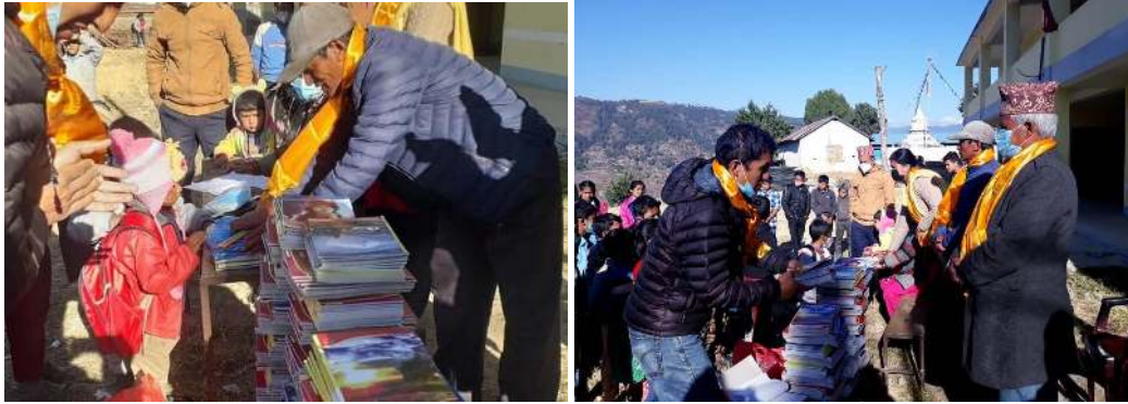
Figuur 4.1: De Sichya jeugd, klaar voor het nieuwe schooljaar.