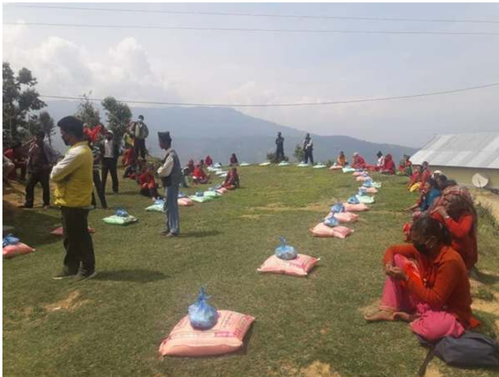
Figuur 2.1: Het uitdelen van een compleet pakket aan voeding voor lokalen die extra steun tijdens de lockdown konden gebruiken.